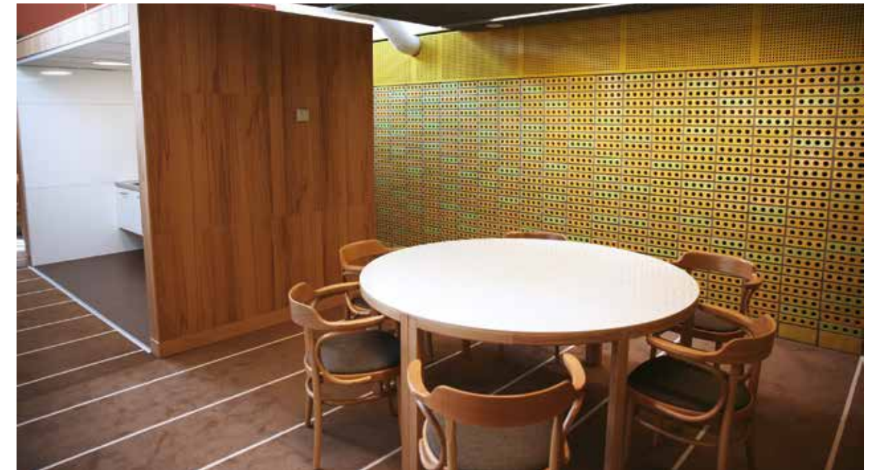
Till vänster i bild syns ett av de pentryn som finns för att studenterna skall kunna ordna med mat och dryck på plats och slippa lämna biblioteket.