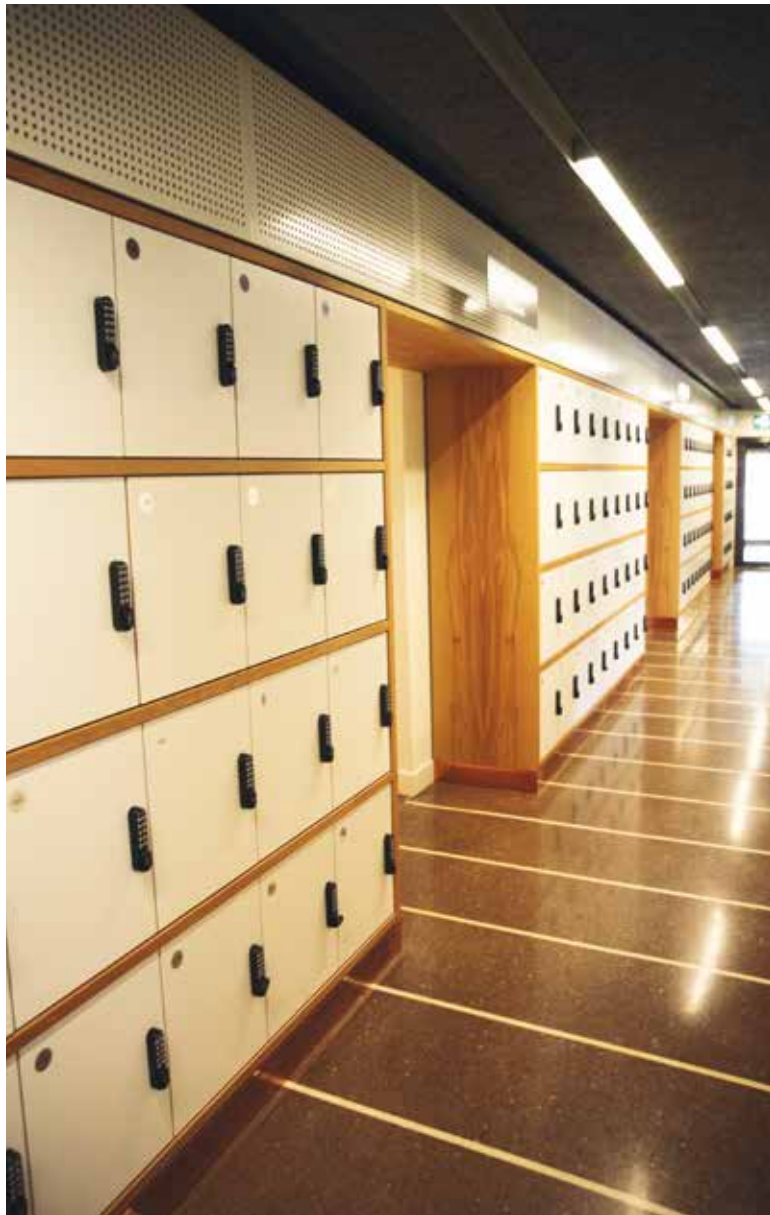
Till och med förvaringsskåpen har fått egen design.