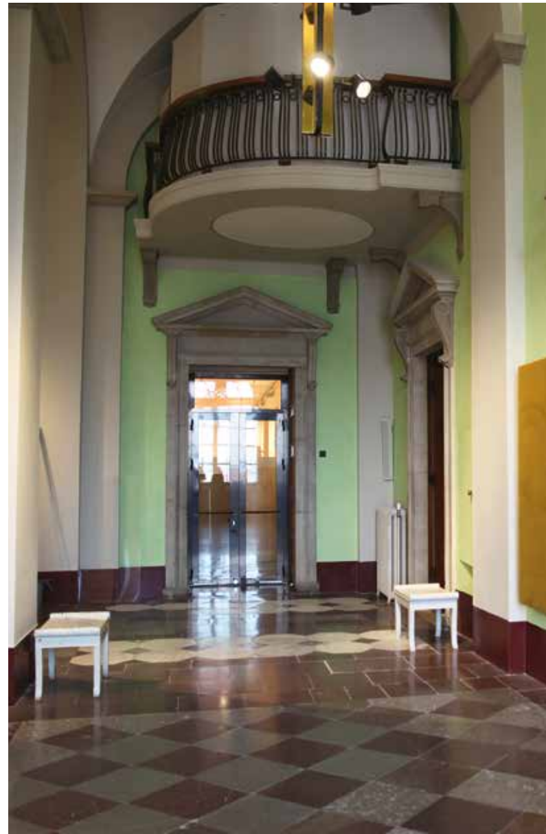
Foajén i Carolina Rediviva har gjorts genomgående så att man fångar upp ljuset från andra sidan.