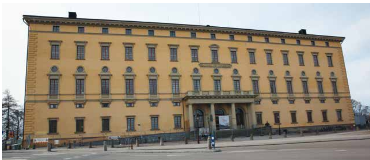
Carolina Rediviva är Uppsalas universitetsbibliotek. Byggnaden invigdes 1841. Namnet betyder "den återuppståndna Carolina" och syftar på det gamla biblioteket från 1600-talet som revs 1778. Renoveringen som presenteras här berör bara en del av fastigheten interiört. Huset härberärgar också den 1500 år gamla Silverbibeln, "Codex Argenteus", som är Sveriges dyrbaraste bokskatt.