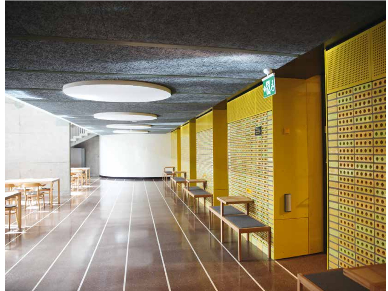
De gula ansiktslyfta kakelklädda väggpartierna är från en tidigare renovering på 1960-talet. Hålen i dem är till för att dämpa ljud i lokalen. Notera bänkarna som konstruerats med ett bord i mitten där det är tänkt att studenten skall ha sin dator.