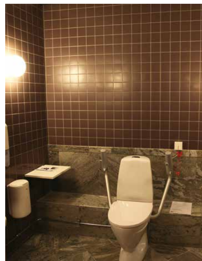
Toaletterna i Carolina Redivivas renoverade del är oenkligen inbjudande med kakel- och marmorklädda ytskikt.

Ombyggnaden av Carolina Rediviva startade våren 2017 och ska stå klar för invigning våren 2019. ♦